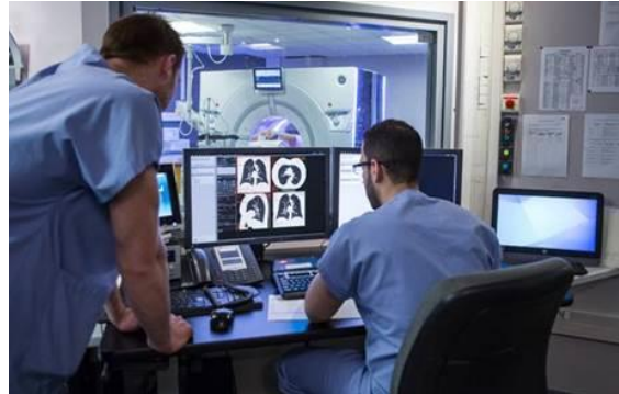
Salle Hybride « nouvelle génération » pour des opérations mini-invasives par sonde avec imagerie interventionnelle